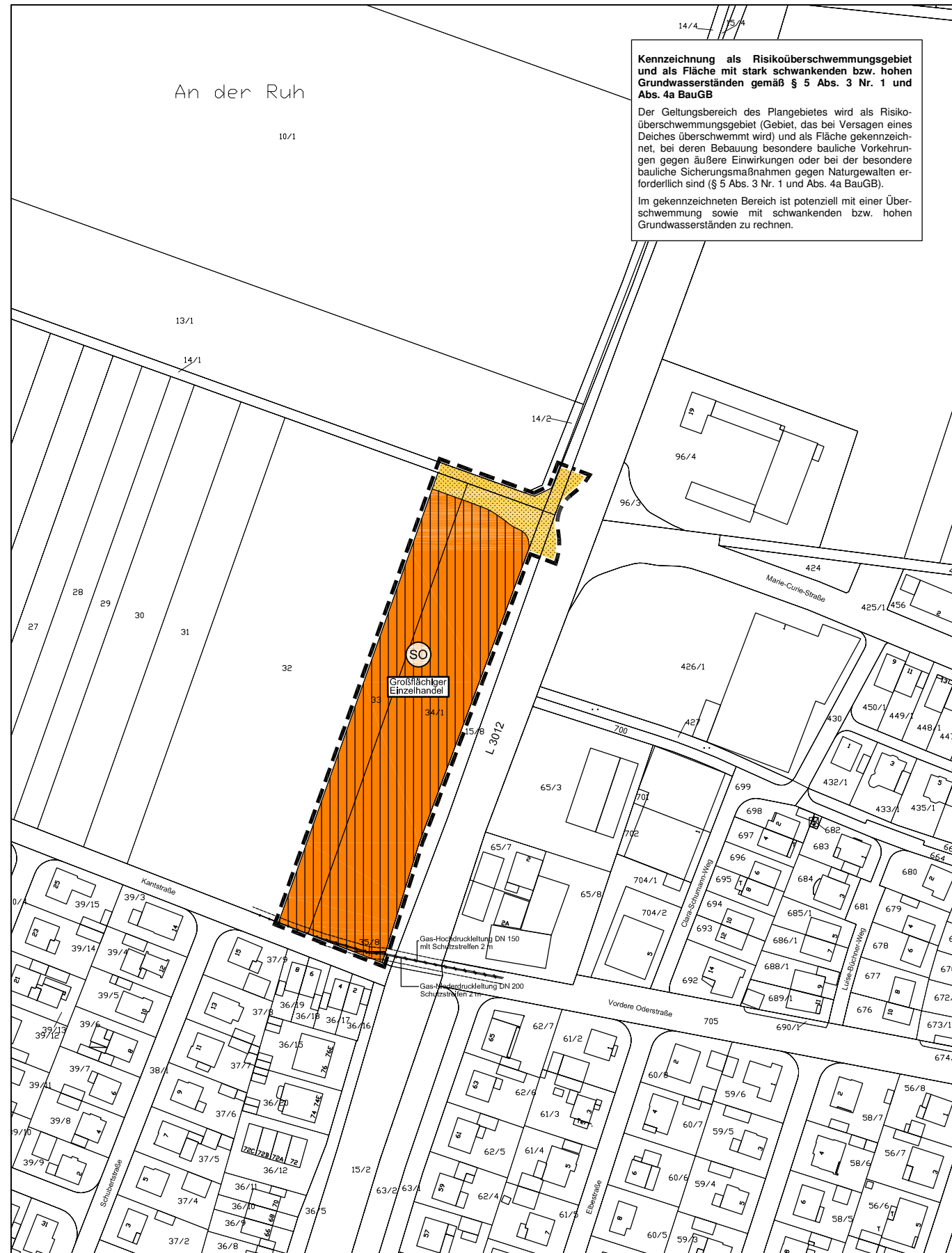
Darstellungen nach der Planzeichenverordnung