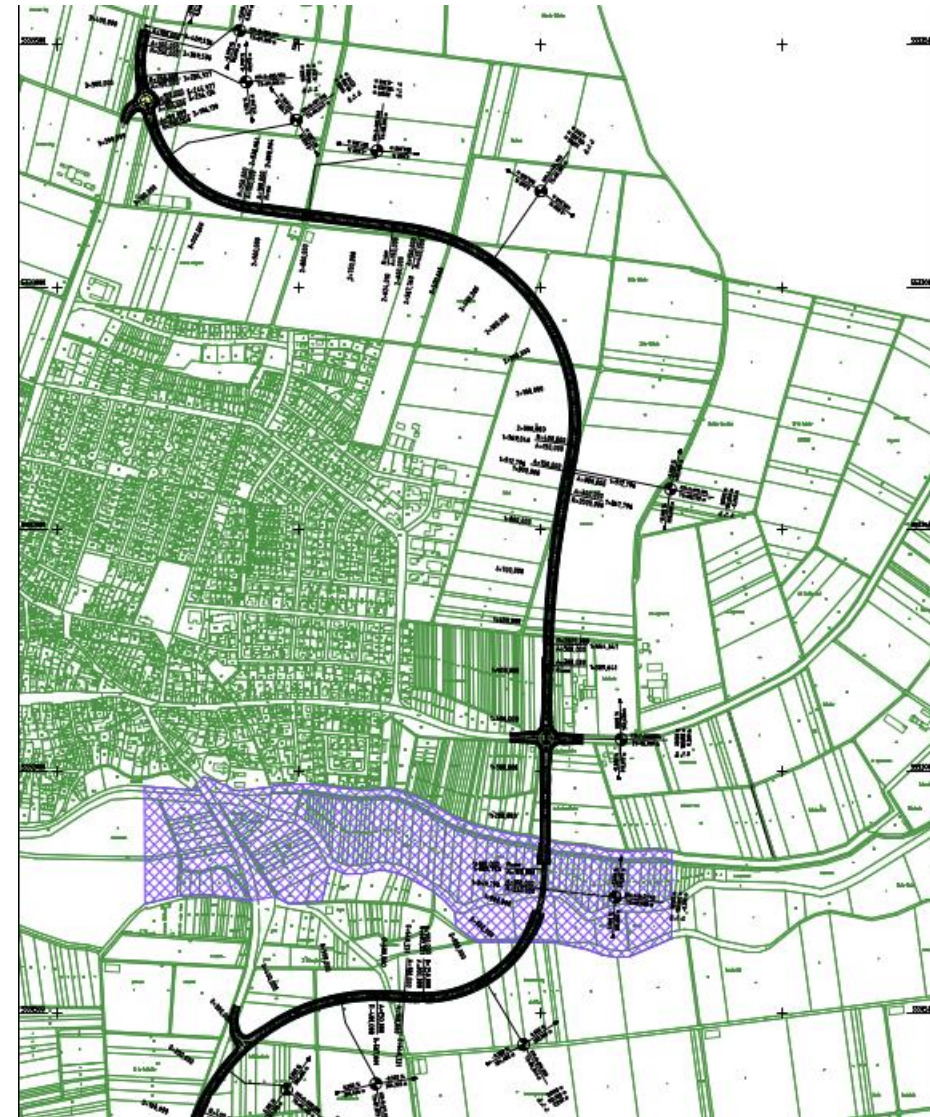
Optimierte Vorzugsvariante aus 2011